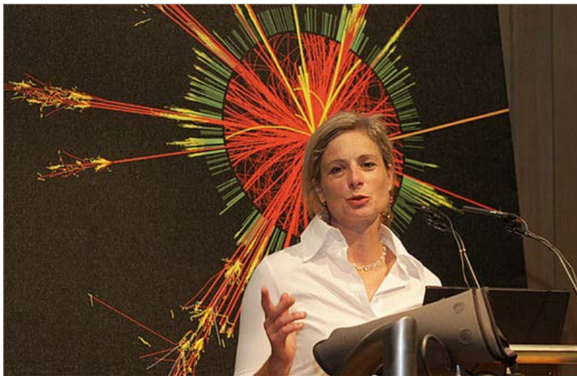
Theoretische Physikerin mit Ausnahmestatus, aber auch Librettistin und Bergsteigerin: Lisa Randall (51)

Mit Lisa Randall weilt derzeit eine absolute Physik-Koryphäe in der Steiermark. In Graz spricht sie über Multiversen, Quarks und Duschvorhänge.